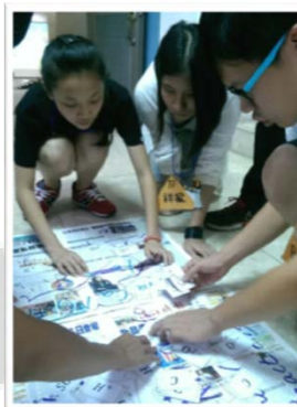
團康、物理、數學活動

http://enroll.tku.edu.tw/course.aspx?cid=sc20170424