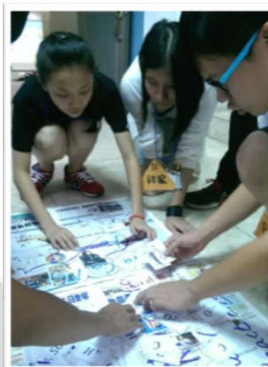
團康、物理、數學活動