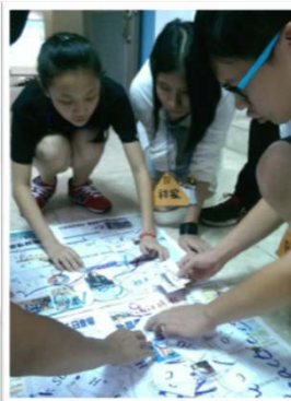
團康、物理、數學活動