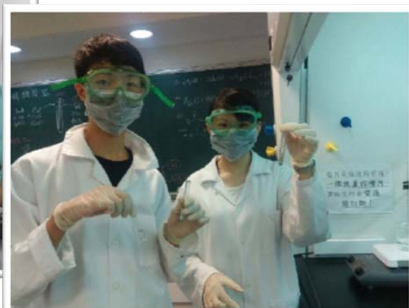
學員進行化學實驗