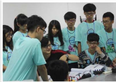
學員進行物理實驗